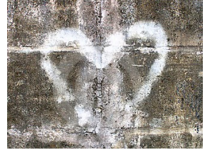
O corazón deixou unha marca na parede ao estoupar

O suceso conosciounou Santiago de Compostela durante a mañá de onte, rebentou un corazón na rúa de Miguel Ángel Blanco. Segundo as testemuñas do suceso un transeúnte ía falando polo seu teléfono móbil cando despois de colgar, suspirou forte e o seu corazón estoupou sen facer ruído ningún.